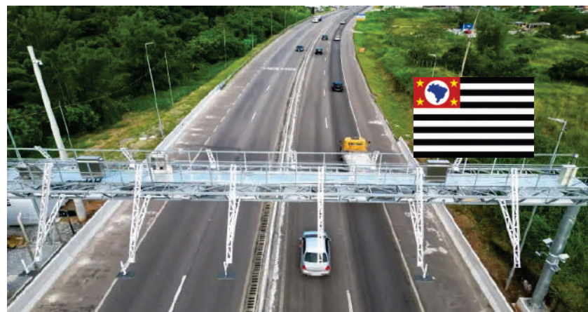
Justiça suspende e depois volta atrás na suspensão das multas por evasão de pedágio Free Flow na região de Mangaratiba

Desde 2023, os motoristas que trafegam entre Iguaí/RJ X Ubatauba/SP, em muitos sequer notam os pórticos instalados com câmeras que são capazes de identificar as placas e emitir cobrança de pedágio que deve ser feita em até 15 dias. O drama de milhares de motoristas começou quando da péssima prestação de serviço feita pela CCR, administradora da rodovia, que implantou fase de testes, contudo aplicou multas através da ANTT, mesmo apresentando instabilidades e falhas em seu site de pagamentos e com nenhuma opção física para ajudar os usuários a pagar sua tarifa. Há motoristas que transitam entre as cidades da região da Costa Verde, muitos deles a trabalho, e quando se deram conta, foram surpreendidos com milhares de multas chegando em seus endereços. Como o número de pessoas afetadas crescia a cada dia, um movimento foi formado com o intuito de pedir o cancelamento dessas multas injustas.