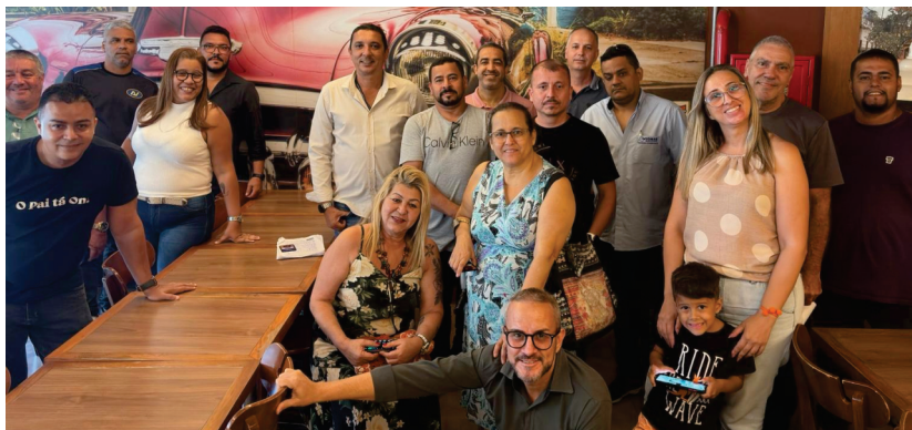
Foto:// Despachantes após reunião no restaurante Graça da Vila